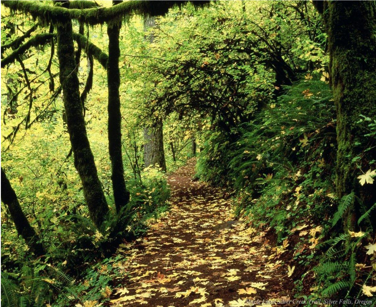
Maple-lined Silver-Creek Trail, Silver Falls, Oregon

Für die meisten Förderthemen existieren viele verschiedene Programme von verschiedenen Institutionen: